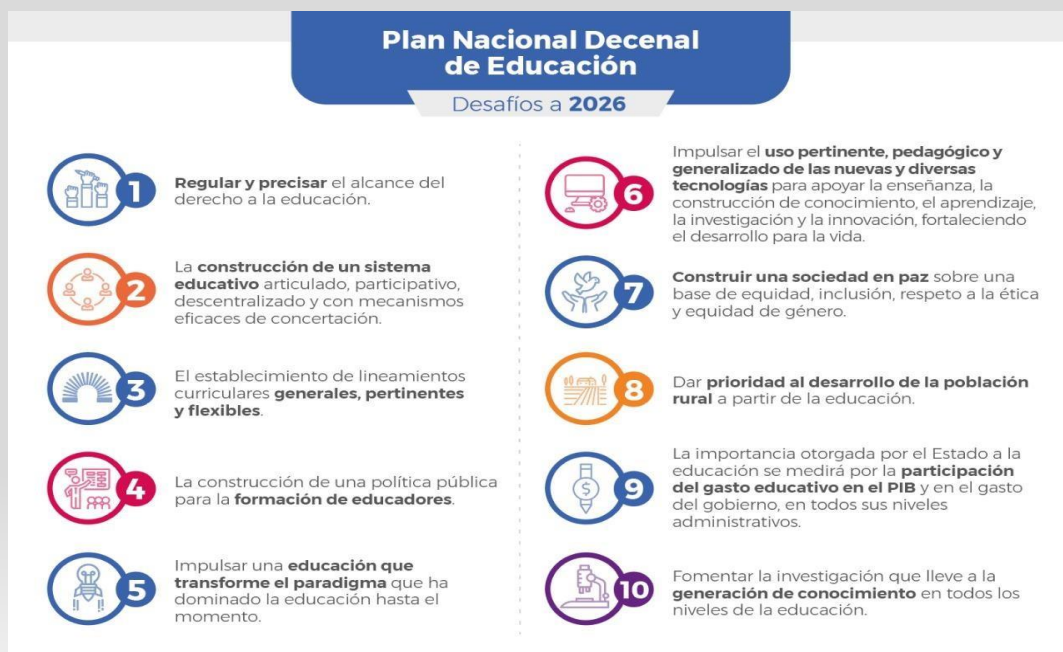
Figura 6. Lineamientos Plan Decenal de Educación