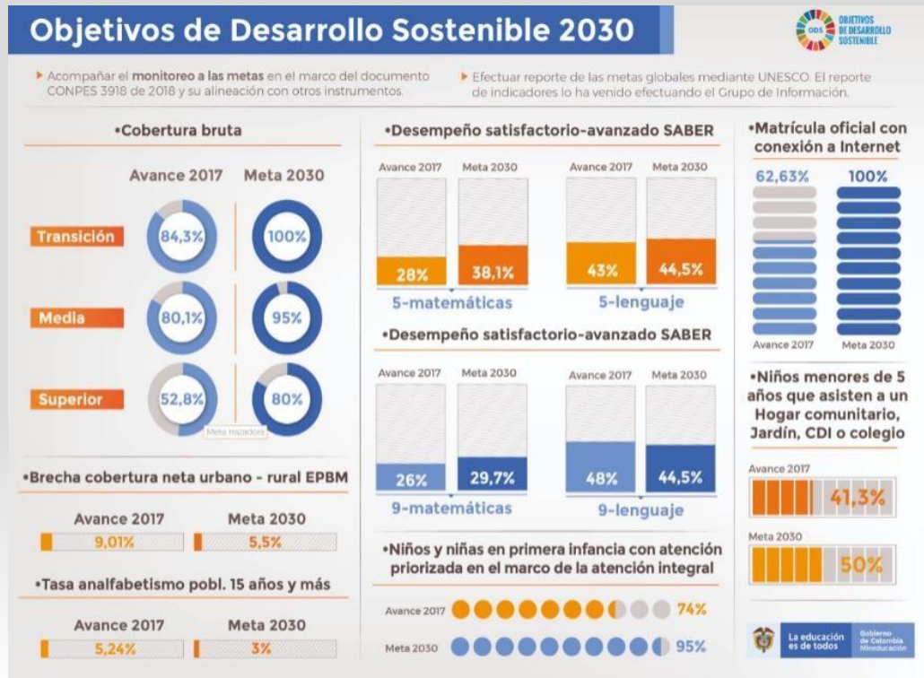
Figura 5. Objetivos de Desarrollo Sostenible con impacto en el sector educación