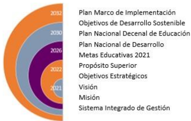
Figura 1. Marco estratégico institucional

El horizonte institucional está constituido por los compromisos adquiridos en agendas internacionales educativas (los objetivos de desarrollo sostenible y las metas educativas 2021) y los lineamientos sectoriales nacionales (Plan Marco de Implementación, Plan Nacional Decenal de Educación y el Plan Nacional de Desarrollo). La siguiente figura agrupa los lineamientos estratégicos según su proyección en el tiempo. Posteriormente, se explica cada uno de ellos.