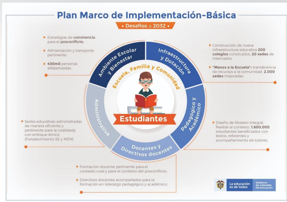
Figura 2. Desafíos del Plan Marco de Implementación para educación preescolar, básica y media.

Este documento contiene el conjunto de pilares, estrategias, productos, metas trazadoras e indicadores necesarios para la implementación del Acuerdo Final, desde los diferentes frentes que deben ser abordados para el cumplimiento de las metas. Las siguientes figuras presentan los desafíos contenidos en el PMI en materia de educación.