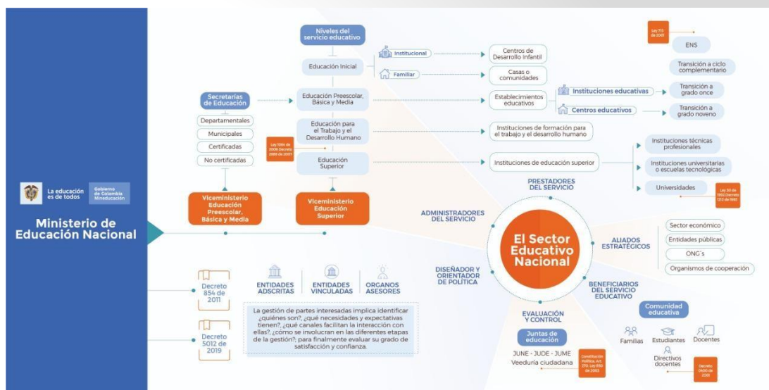
Figura 1. Actores Relevantes y Partes Interesadas del Sector Educativo

En la siguiente figura se muestran los actores y partes interesadas del sector: