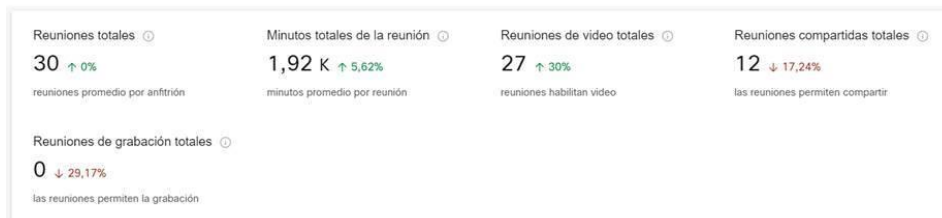
Imagen 2: Estadísticas de reuniones (Ene – Abr)

licenciamiento de una herramienta que ha permitido la conexión de hasta un número de 3000 asistentes por evento, estadística que se soporta en la siguiente información la cual se extrae de los reportes de la herramienta Webex, como se observa a continuación: