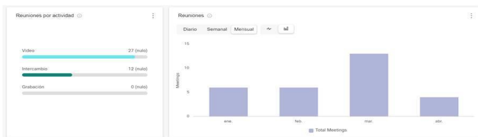
Imagen 3: Cantidad de reuniones mensuales (Ene – Abr)