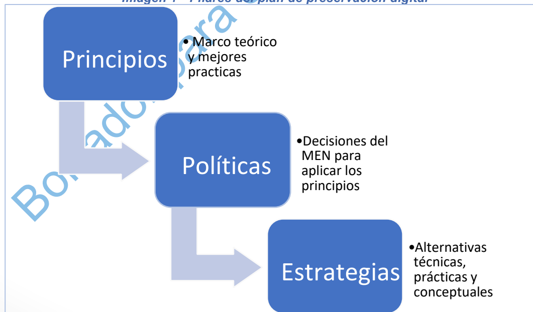
Imagen 1 - Pilares del plan de preservación digital

Principios. El concepto de Principios será entendido como el marco teórico y de mejores prácticas para el desarrollo del Plan de Preservación Digital a Largo Plazo.