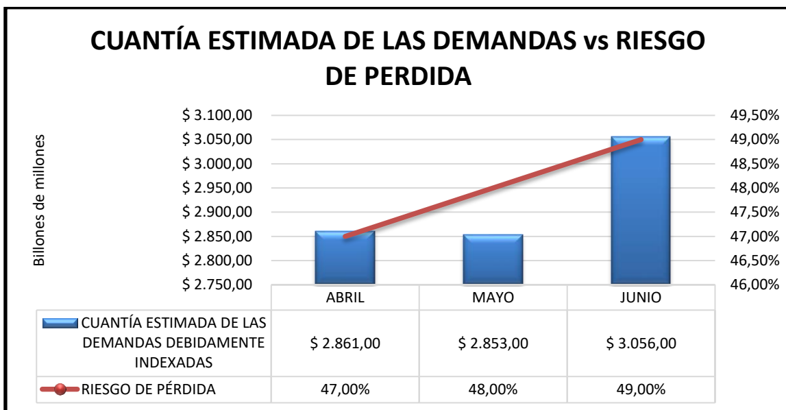
Gráfico 2. Cuantía estimada de las demandas Vs Riesgo de pérdida II trimestre de 2020.

El riesgo de pérdida tiene un comportamiento creciente leve durante el segundo trimestre, así mismo, la cuantía estimada para el mes de junio presenta un crecimiento considerable debido a la actualización de la cuantía del proceso 86001334000220190027700 que paso de 414.058.000 a 193.505.498.942.