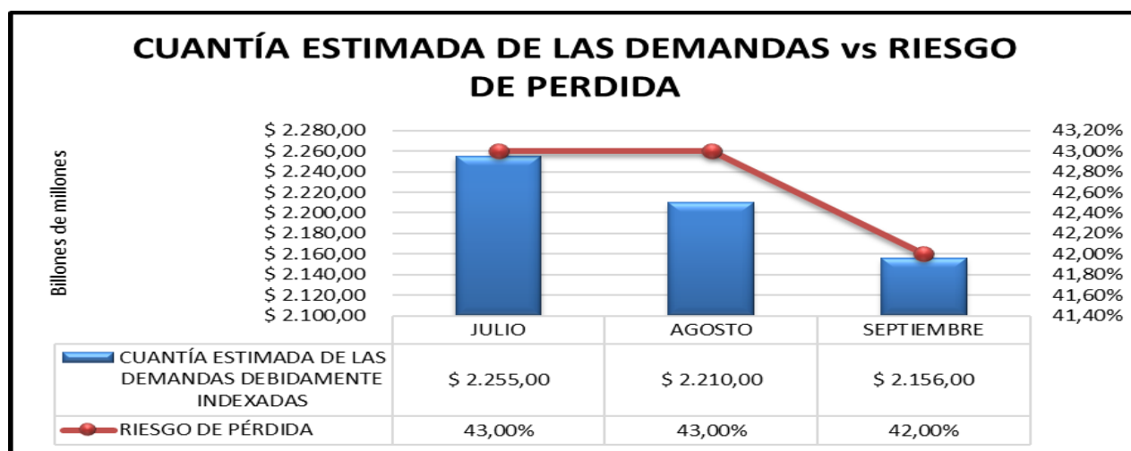
Grafico 2. Cuantía estimada de las demandas Vs Riesgo de pérdida.

El riesgo de pérdida tiene un comportamiento constante durante los meses de julio y agosto en un 43% y en el mes de septiembre en un 42% de probabilidad de pérdida.