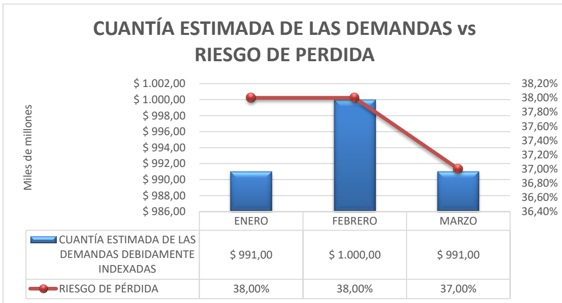
Grafico 2. Cuantía estimada de las demandas Vs Riesgo de pérdida IV trimestre de 2018.

El riesgo de pérdida tiene un comportamiento constante en los meses de enero y febrero en un 38% y en el mes de marzo en un 37% de probabilidad de pérdida.