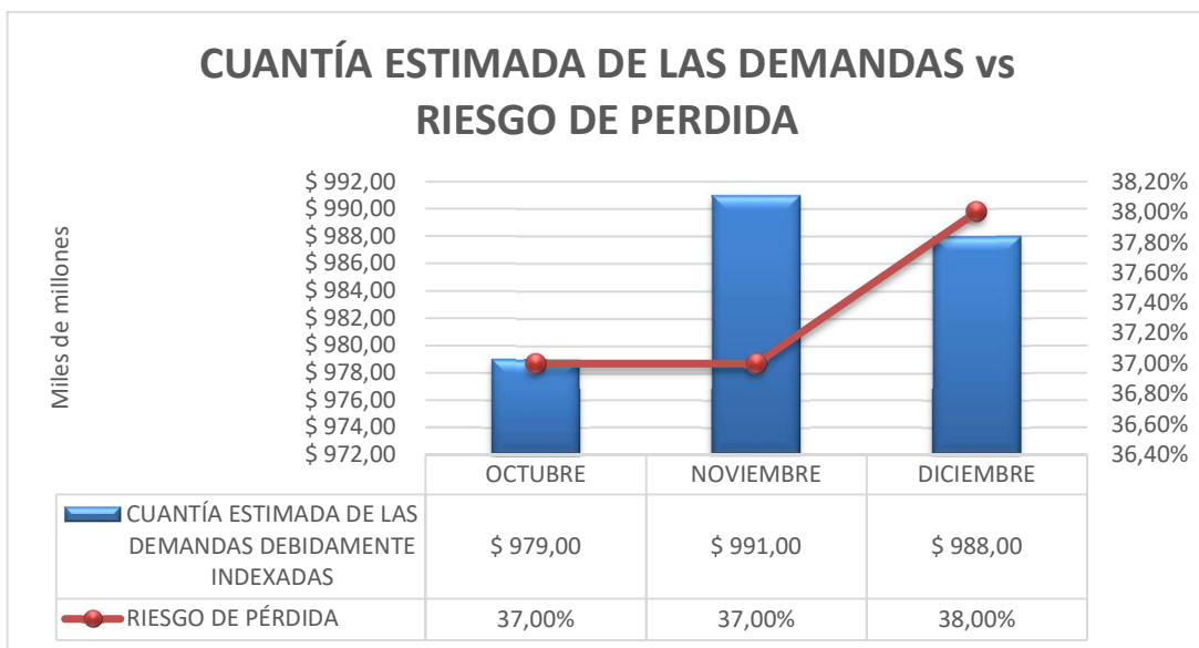
Grafico 2. Cuantía estimada de las demandas Vs Riesgo de pérdida IV trimestre de 2018.

El riesgo de pérdida tiene un comportamiento constante en los meses de octubre y noviembre en un 37% y en el mes de diciembre en un 38% de probabilidad de pérdida.