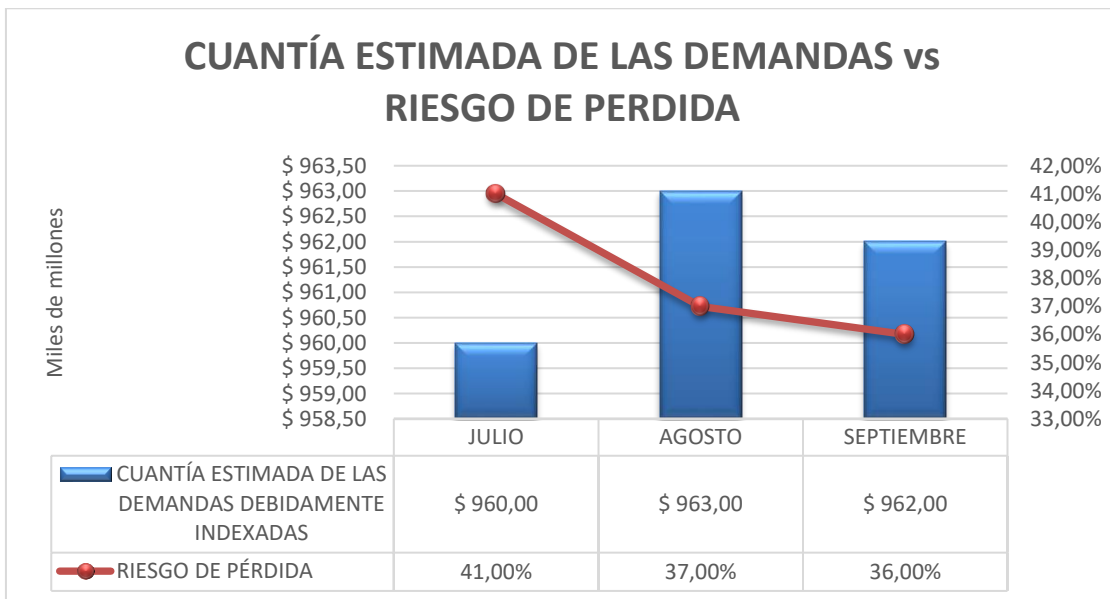
Grafico 2. Cuantía estimada de las demandas Vs Riesgo de pérdida.

El riesgo de pérdida tiene un comportamiento variado al estar en el mes de julio en un 41%, en el mes de agosto en un 37% y en el mes de septiembre en un 36% de probabilidad de pérdida. Por último, los comportamientos de la cuantía estimada de los casos tienen unos leves crecimientos esto dado que se están indexando cada uno de los casos mes a mes.