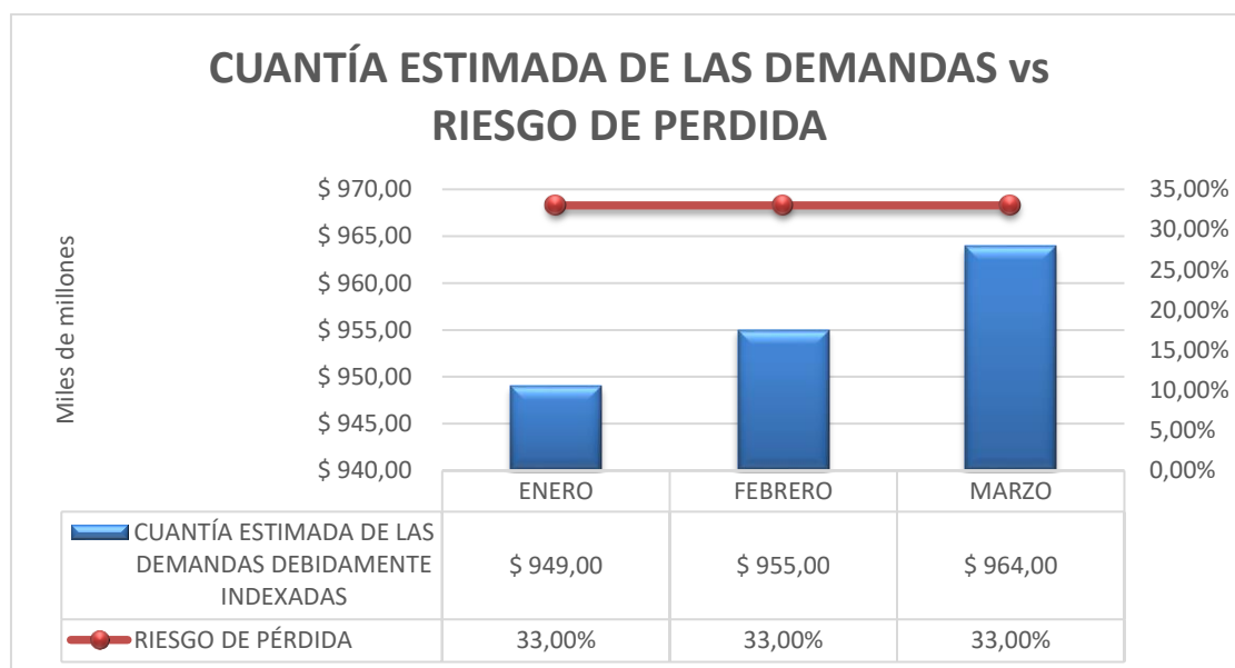
Grafico 2. Cuantía estimada de las demandas Vs Riesgo de pérdida.

El riesgo de pérdida tiene un comportamiento constante al estar en el primer trimestre con un 33% de probabilidad de pérdida. De igual manera los comportamientos de la cuantía estimada de los casos tienen unos leves crecimientos esto dado que se están indexando cada uno de los casos mes a mes.