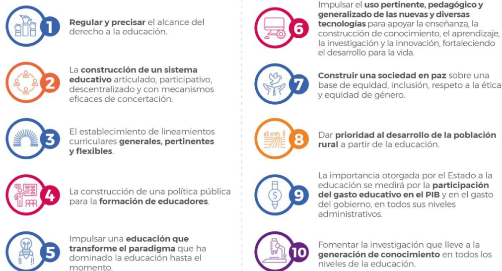
Ilustración 4. Desafíos Plan Nacional Decenal de Educación 2016-2026